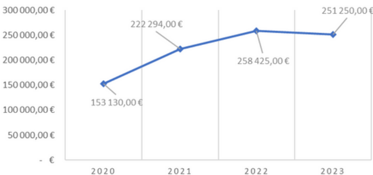
EVOLUTION DES DOTATIONS DES FILIALES

Des montants qui ne reflètent pas l'échelle du groupe