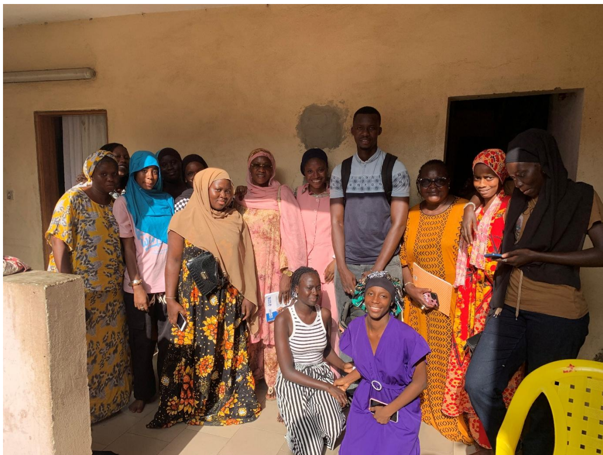
Figure 10 : Photo avec le groupe 3 « And Liggèy »