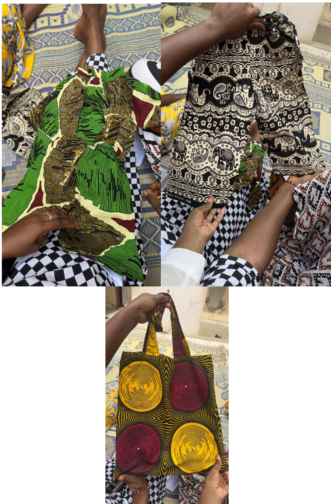
Figure 6 : Ensemble en Wax produit par des membres du groupe 3 « And Liggèy »