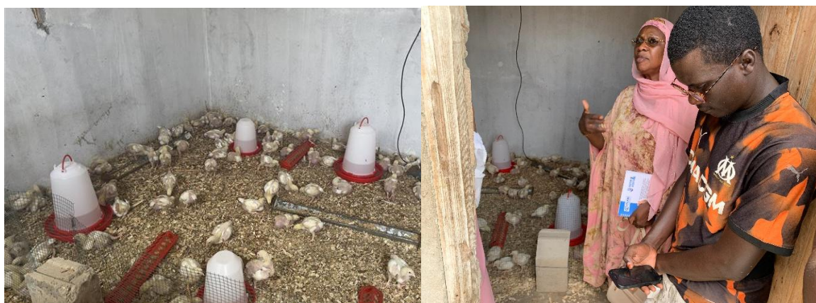
Figure 4 : Poulailler avec le Kit de démarrage