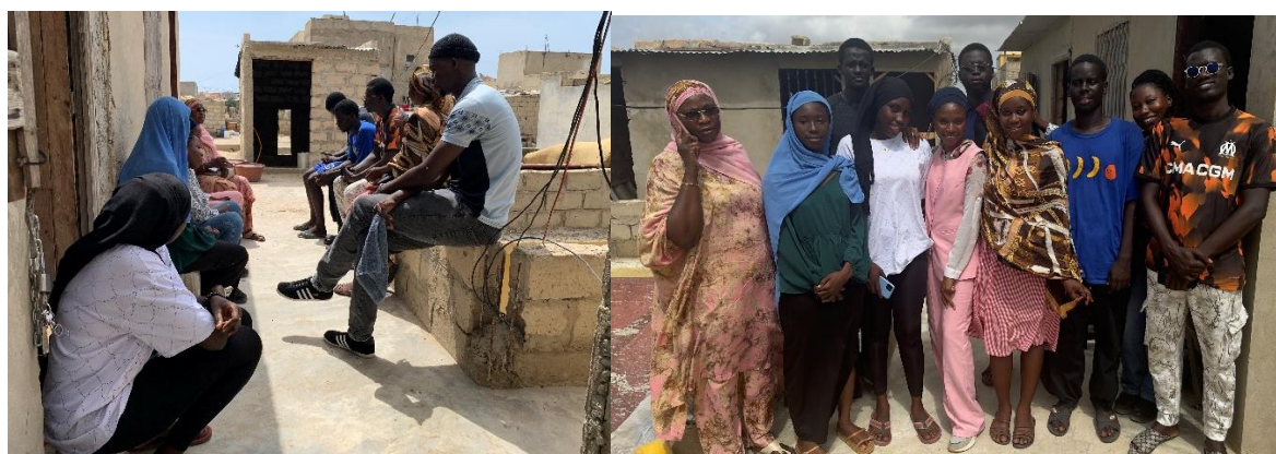
Figure 5 : Echange sur le projet

Le troisième groupe rencontré fonctionne également sous le format AJEC et bénéficie de l'accompagnement d'une Badianou Gokh , qui signifie une marraine de quartier. Elle les assiste et les éduque sur la gestion collective et l'autonomisation des jeunes. Ce groupe illustre la diversité des activités soutenues par le programme OSEER, en mettant l'accent sur l'entrepreneuriat artisanal et la transformation alimentaire.