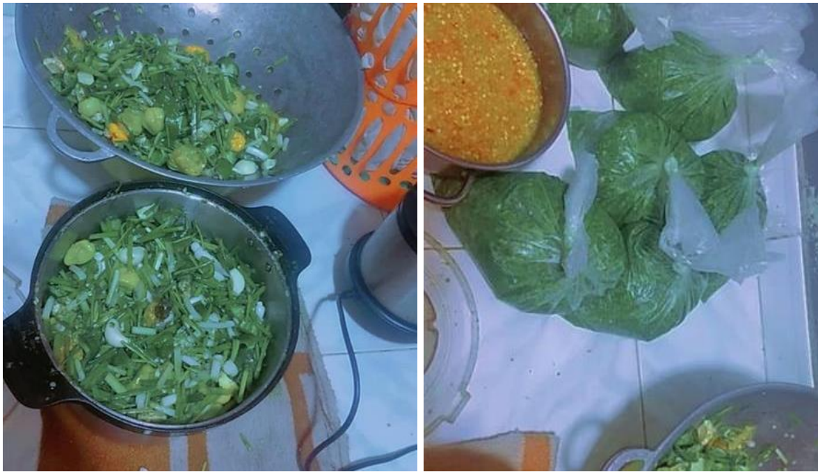
Figure 7 : Nokoss préparé et vendu par une membre du groupe