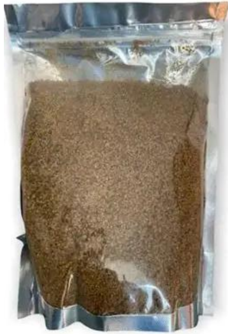
Figure 9 : Araaw de Thiakri à base de mil

Le groupe applique une approche collective : chaque membre contribue à la production et à la gestion des activités, en mettant en pratique les compétences acquises lors des formations proposées par le programme. L'accompagnement du Badianou Gokh permet de renforcer la cohésion du groupe, d'assurer un suivi qualitatif des activités et d'encourager la discipline financière et organisationnelle. Ce groupe est à sa deuxième année d'existence.