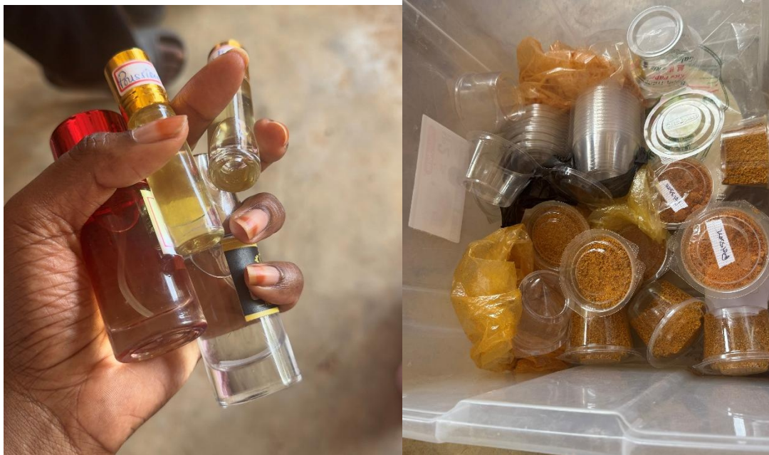
Figure 2 : Quelques produits vendus par les membres du groupe